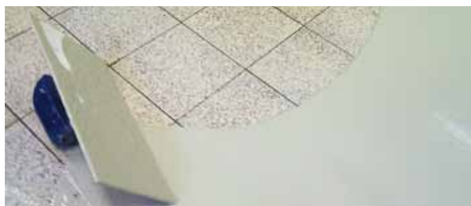
Saubere Oberflächenbehandlung mit Kunststoff

KUNSTSTOFFBESCHICHTUNGEN sind die optimale Alternative zu Fliesen und anderen Werkstoffen – schnelles Auftragen, lange Haltbarkeit und hohe Belastbarkeit. „Der Schwerpunkt unserer Beschichtungsarbeiten liegt beim Einbau und der Sanierung zum Schutz und zur funktionalen Aufwertung von Betonflächen im Bereich Industriehallen, Fahrwegen, Auffangwannen und Maschinensockeln“, so Helga Rübke. „Als Fachbetrieb nach § 19 I WHG erstellen wir chemisch resistente sowie elektrisch ableitende Beschichtungen für Tankstellen, Waschanlagen und die chemische Verarbeitung.“